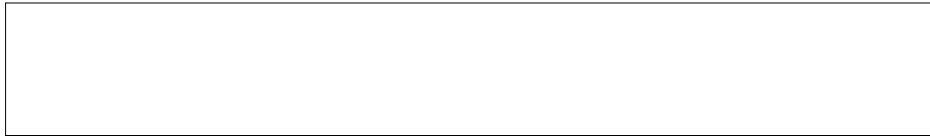
907 - weiß 150, 218, 250, 300 cm RAL 9010