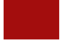
370 - karminrot 218, 250 cm RAL 3002