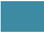
549 - lichtblau 218, 250 cm RAL 5012