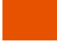
244 - reinorange 250 cm RAL 2004