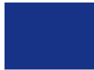
543 - königsblau 218, 250 cm