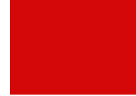
340 - coca cola 250 cm Rot 2000