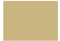
123 - beige 250 cm RAL 1014